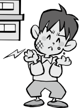
「しみる」と思ったら 早めの受診を!