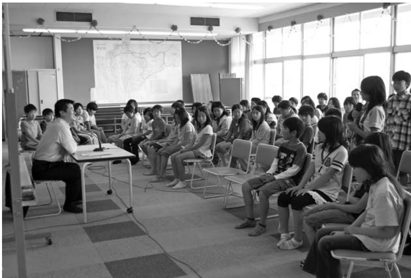
▲北泉小で行われた「市長と6年生が語る会」

市ではこれまで自治会を中心に、市長が本庄市の行財政状況や課題等について説明し、意見交換を行う「市民と市長の対話集会」を行ってきました。自治会を対象とした集会は、これからも続けていく予定ですが、今後は、さまざまなグループのみなさんとの話し合いを通して、より多くの人の意見を聞かせていただきたいと思っています。