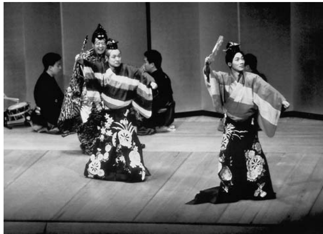
二人袴：親(左) 野村万作 髯(右) 野村萬斎

問い合わせ先 企画課 ☎25-1157、市民文化会館 ☎24-2841、早稲田大学文化企画課 ☎03-5272-4653