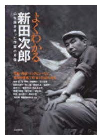
よくわかる 新田次郎 山と溪谷社 編