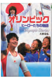
オリンピック ヒーローたちの物語 大野 益弘 著