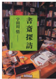
書齋探訪 宇田川 悟 著