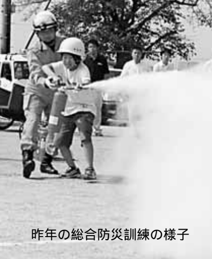
昨年の総合防災訓練の様子