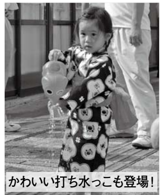
かわいい打ち水っこも登場!

て空気が流れたため、温度を測定すると1度低下しました。また、路面温度は47度から40度になり7度下がりました。