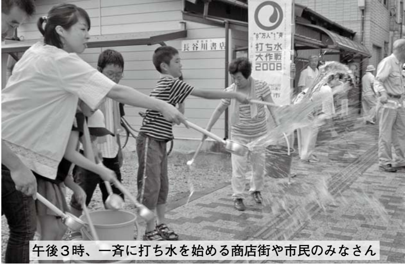
午後3時、一斉に打ち水を始める商店街や市民のみなさん