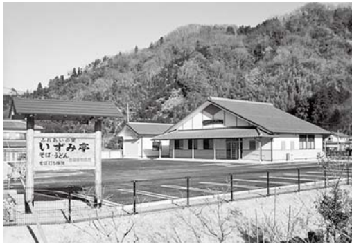
県道秩父児玉線沿いに建つ 本庄市ふれあいの里いずみ亭

9月22日（月）～10月6日（月）（土・日・祝日を除く） 午前9時～午後4時30分（正午～午後1時を除く）