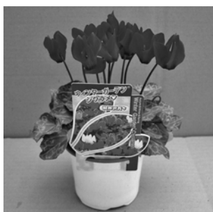
ガーデンシクラメン

今後は、さらに品質の向上を目指すとともに、消費者のみなさんの動向を的確にとらえながら、「買ってよかった、またぜひ買いたい」と思っていただけの商品作りを心がけたいです。また、数年前から生産を始めているバラの鉢物など、新しい商品にもチャレンジして、後継者の息子に任せたいと考えています。」