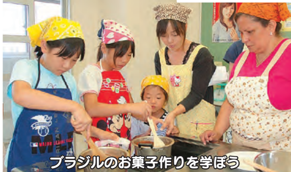
ブラジルのお菓子作りを学ぼう