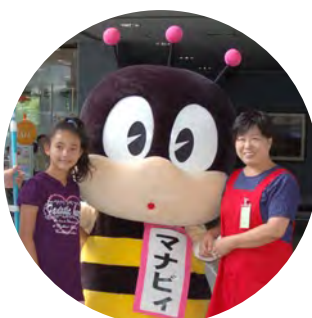
「学び」とミツバチの「bee」(ビー)から名付けられました

8月18日、生涯学習のマスケット、マナビイが市役所を訪問しました。マナビイは、10月30日(金)から行われる第21回全国生涯学習フェスティバル「まなびピア埼玉2009」のPRのため訪れました。