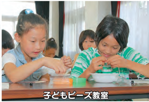
子どもビーズ教室