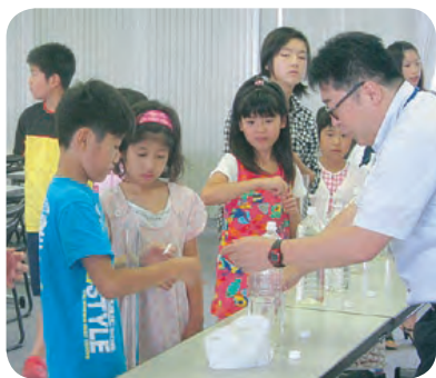
事前学習会の様子