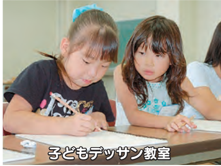
子どもデザイン教室