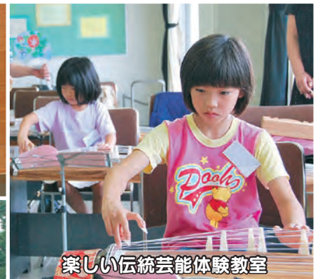
楽しい伝統芸能体験教室