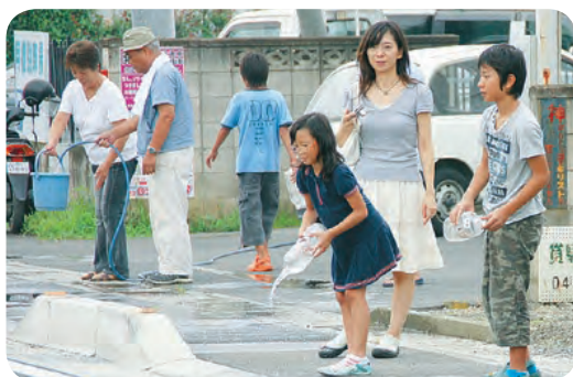
みんなで打ち水「涼しくな〜れ」