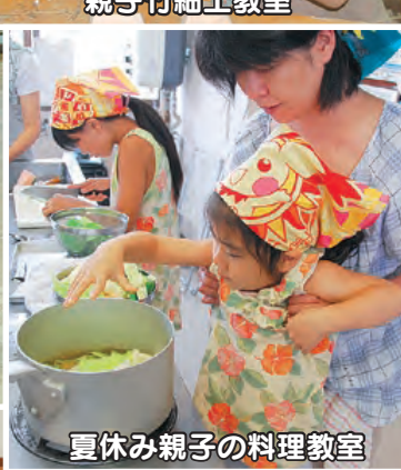
夏休み親子の料理教室