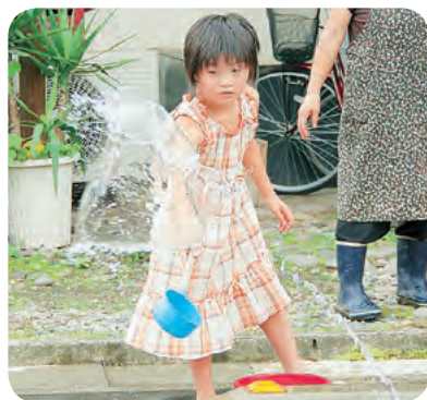
ちびっこも「えいやっ」

バケツやペットボトル、じょうろを手にしたみなさんは、合図とともに勢いよく打ち水を開始。終了後には、気温が1度、路面温度が5・8度下がりました。