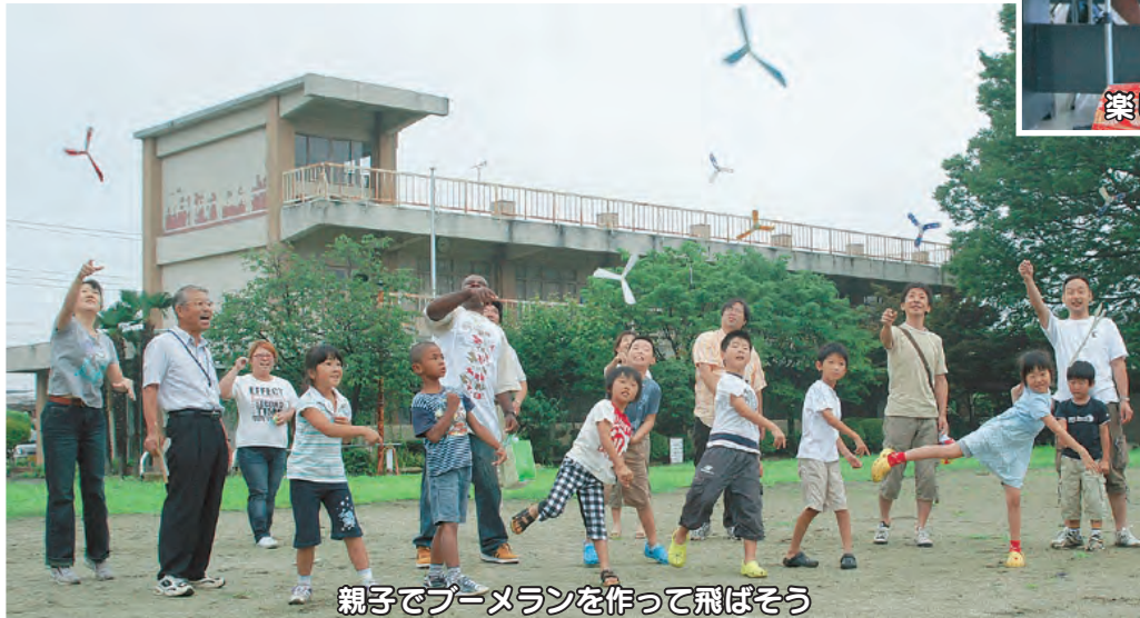
親子でブーメランを作って飛ばそう