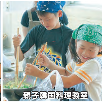
親子韓国料理教室