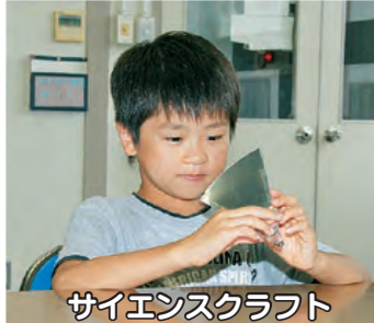
サイエンスクラフト