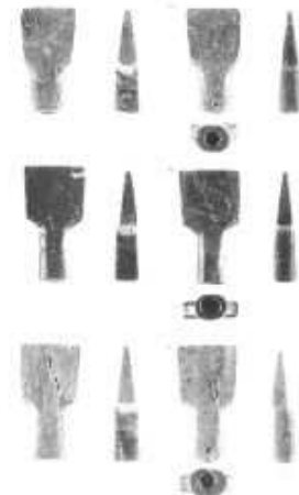
右、石製模造品の一部