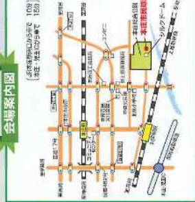
※会場には、なるべく自販機・携帯でのご決済ください。

後援：本庄市・本庄市教育委員会・本任務工務所・原玉岡工芸会・埼玉商工会・埼玉五ひびきの農業協同組合 特別協賛：花園フォレスト・ウニクス上里・ライオン(株)