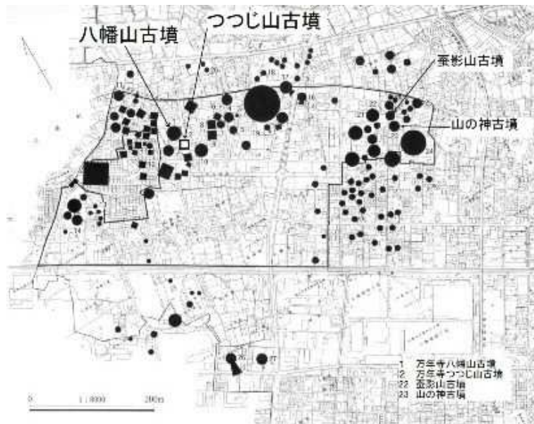
旭・小島古墳群分布図

参考文献 2006『旭・小島古墳群—林地区 I—』本庄市埋蔵文化財調査報告書第 3 集