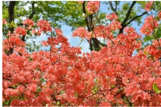
新緑と山つつじが楽しめます