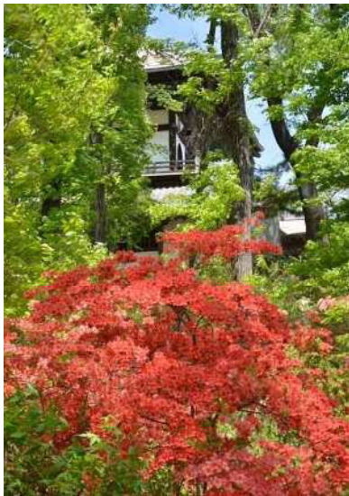
成身院百体観音堂と

「ふるさとの森公園」遊歩道の山つつじが、見頃を迎えています。 新緑と山つつじのコントラストが、差し込む光の中で美しく遊歩道を彩ります。