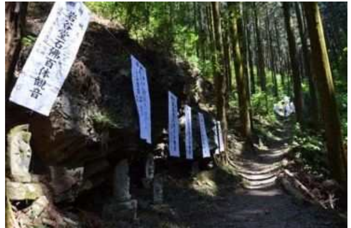
(岩谷堂万霊供養祭)