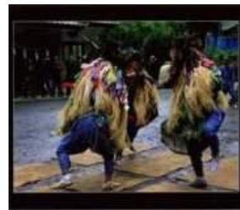
本庄市議会議長賞 「秋雨に舞う」