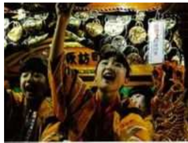
本庄市長賞 「祭りっ娘」