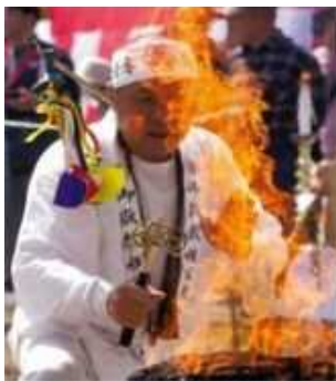
本庄市観光協会長賞 「護摩祈禱」