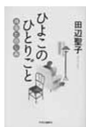
ひよこのひとりごと 田辺聖子 著