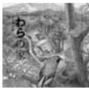
わらの家 大岩剛一 著