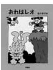
おれはレオ 佐々木マキ 作