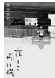
飛行機をゆく夜 角田光代 著