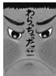
わらっちゃった 大島妙子 作