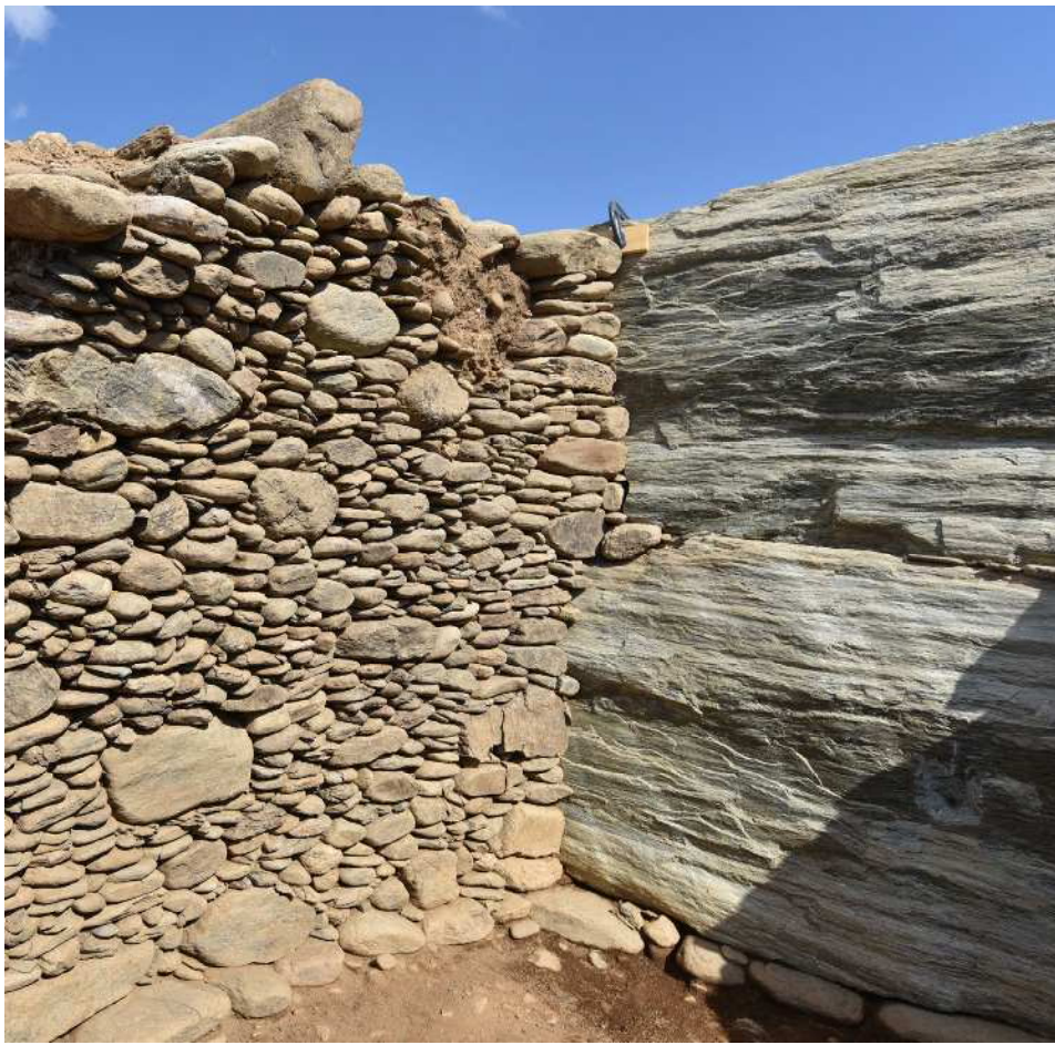
▲元富東古墳（東富田） 石室内部の様子

この展示では、これまでの発掘調査によって出土した資料を通して、ミュージアム周辺の古墳を紹介します。