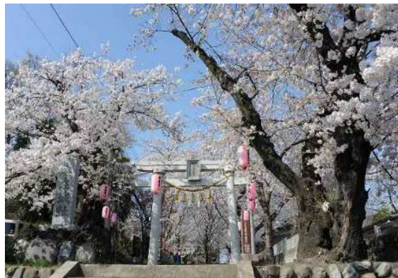
（城山稲荷神社の桜）