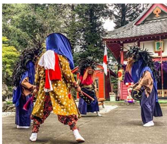
（日枝神社での獅子舞の様子）