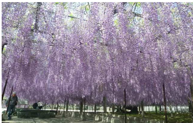
（藤のカーテンは圧巻）

児玉 33 霊場 31 番札所、 ちようせんじ 長泉寺（大用山長泉寺）の境内にあるこの藤は、埼玉県の天然記念物に指定されており、樹齢 650 年と推定される木をはじめ、その他にも樹齢 250 年、350 年といわれる古い木があります。見頃は、4 月下旬から 5 月中旬となり、白や紫などの見事な花を咲かせます。藤棚の広さ 2,500 m 2 にもおよび、花房は 1.5m もの長さには達するものもあります。