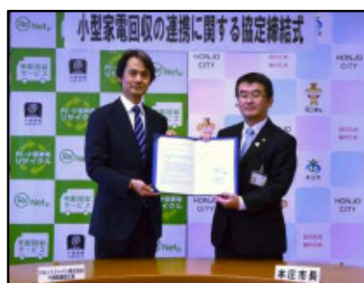
協定式の様子(平成27年12月17日)