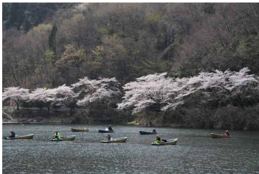
本庄市自治連合会長賞 釣り人の春