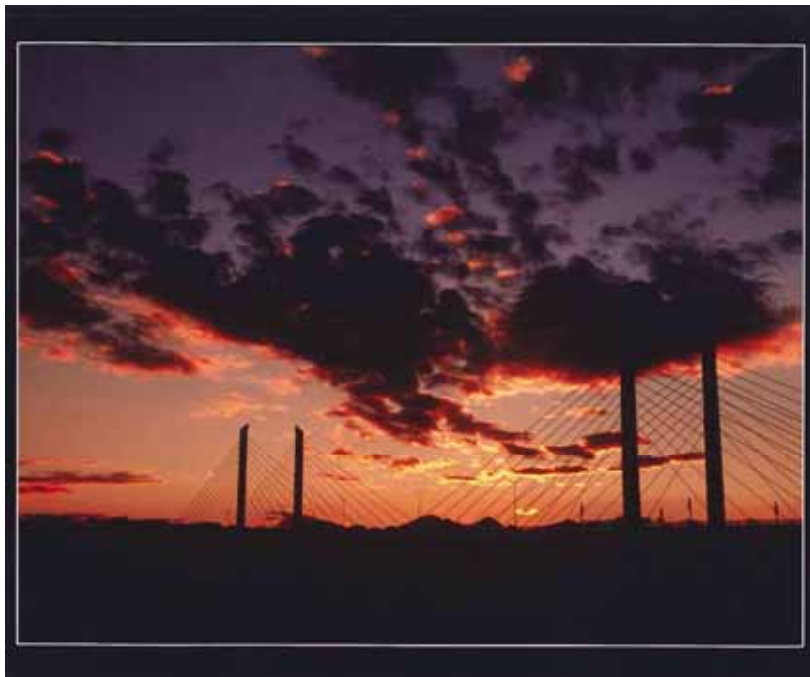
本庄市観光協会会長賞 夕景