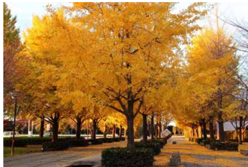
本庄市長賞 黄金色の公園