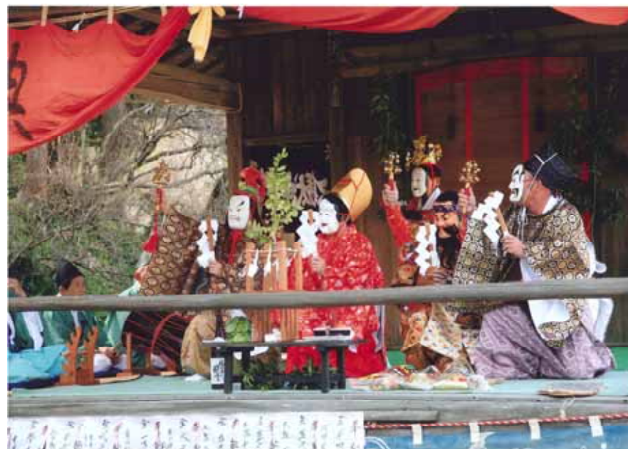
本庄市長賞 神楽岩戸開