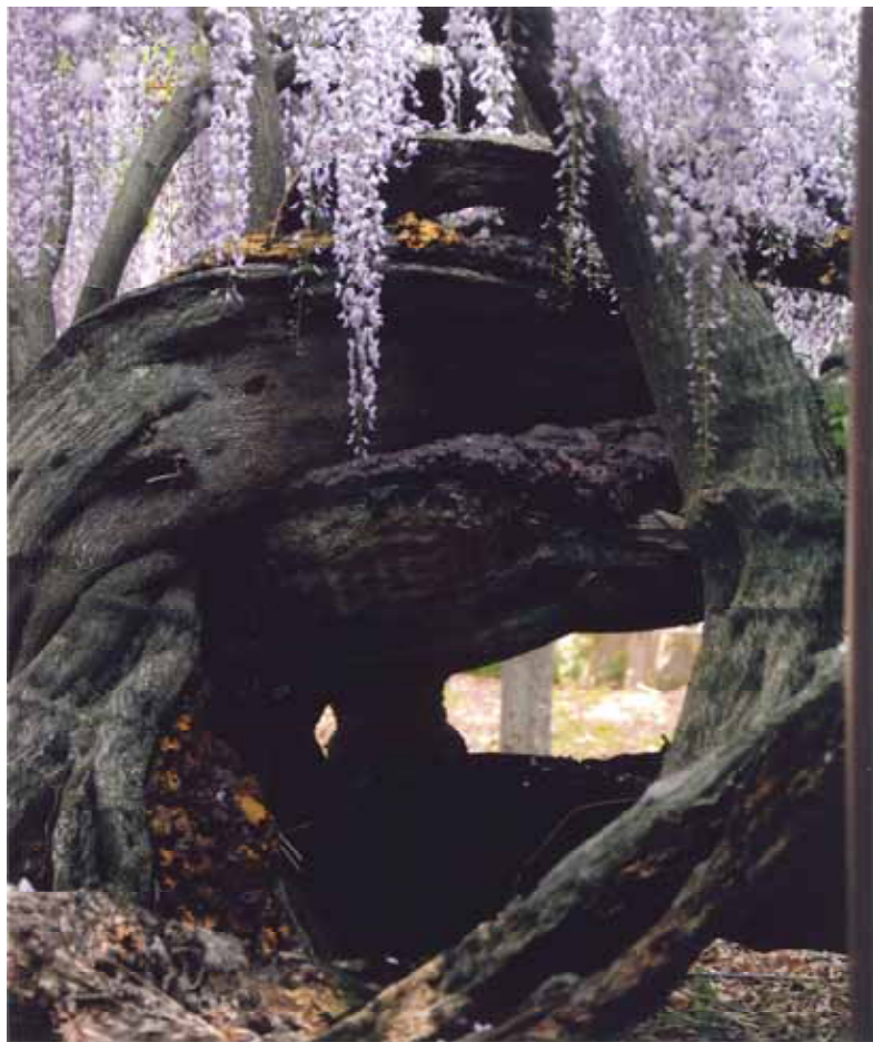
本庄市観光協会賞 フジの根