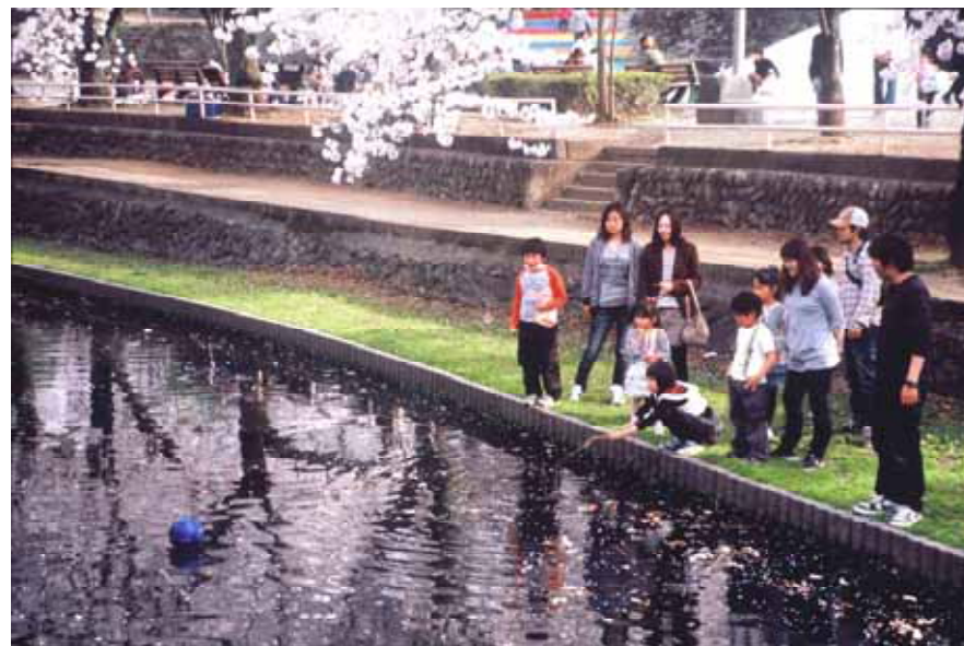
本庄市議会議長賞 取れるかな？