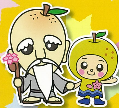
神川町マスコット 神じい なっちゃん