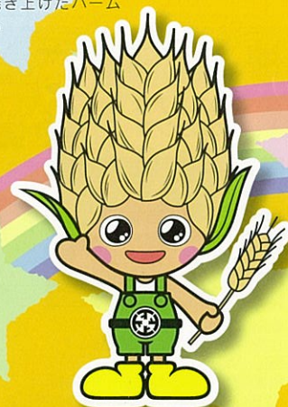
上里町マスコットキャラクター こむぎっち