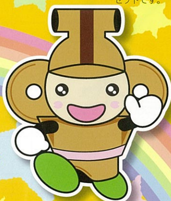
本庄市マスコット はにぼん