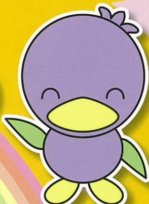
美里町マスコット ミムリン