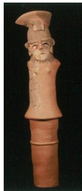
笑う表情の鬘を結った女性の埴輪

*本庄市のマスコットキャラクター「はにぼん」のモデルとなった笑う盾持人物埴輪と同じ「前の山古墳」から出土した女性の人物埴輪です。