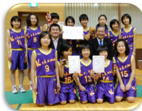
表 彰 大会を通して優秀な成績を収めたチーム・個人に賞を授与する。

日 程 開 場 (8:00) 開会式 (8:15~8:30) 第1~第6試合 (8:45~15:30) フリースロー大会 (15:30~16:00) 第7試合[決勝戦] (16:00~17:00) 閉会式・表彰式 (17:00~17:30)