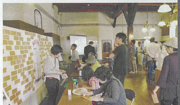
一般公開と企画展示 「旧本庄商業銀行煉瓦倉庫と本庄のあゆみ」 主催 | 本庄市 2013年6月1日 6月2日