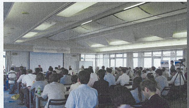
シンポジウム 「旧本庄商業銀行煉瓦倉庫の保存・活用を考える」 主催 | 本庄市 2013年6月2日