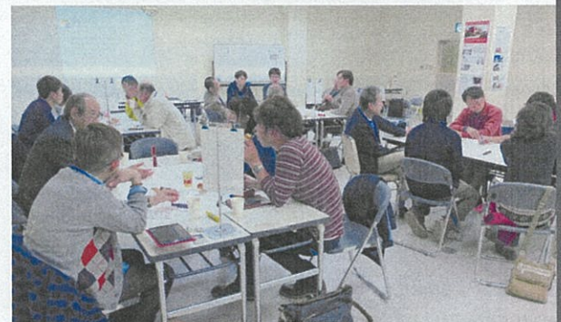
公開ワークショップ 「旧本庄商業銀行煉瓦倉庫の利活用を考える！」 主催 | 本庄煉瓦倉庫の利活用を考える市民の会 2013年11月23日