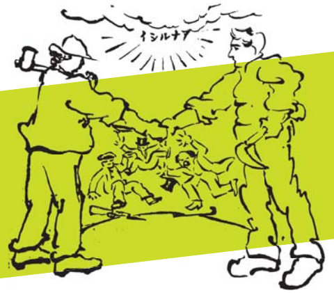
『ダイナミック』24号挿絵（本庄市立図書館所蔵）