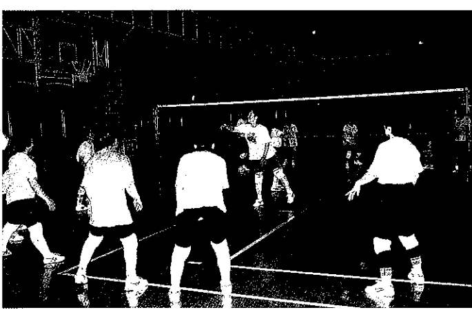
本庄市インディアカ協会「市民教室」

昭和五十一年に「日本インディアカ協会」が設立。本庄市は早く、PTA、婦人会に取り入れ、五十七年には、第一回健康体力づくり、レクリエーションの集い「インディアカ大会」を年代別トーナメントで開催し、この大会の優勝は三十代が若菜A、四十代が東今井、五十代が七軒町の各チームでした。その後、愛好者が増え、六十一年七月十一日「本庄市インディアカ協会」を十八チーム一五七名で設立し、県協会、市体育協会に加盟。平成五年に「本庄市レクリエーション協会」