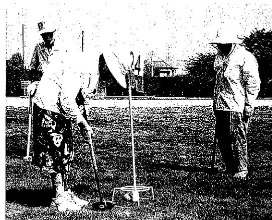
本庄市グラウンド・ゴルフ協会「都市親善大会」

定でき、楽しむことができます。ルールは簡単で、参加したその日から仲間と楽しくプレーできます。競技時間が決まっていなくても、のびのびとプレーすることができます。また競技中の判定は、審判員がするのでなく、同伴プレーヤーが公平に行なうのです。それだけプレーヤーはマナーやエチケットを守ることが必要です。