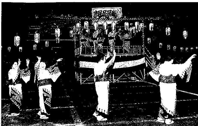
本庄民踊レク連盟「市民民踊大会」

現在の活動状況は、毎月四回の研究会の他県民踊大会、西北支部大会、市民民踊大会、本庄まつり、七夕祭民踊流し、芸能まつり等へ参加し、県の指導等を受け、民踊の普及啓