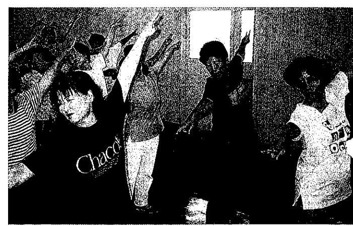
本庄市レクエーション・ダンス連盟「講習会」

今年、三十一回総会を迎えました。 年間行事（年会費一、〇〇〇円） 四月二十七日 高崎山観音 洞窟観音花見 六月八日 茨城県潮来あやめまつり 六月二十二日 群馬県境町歩こう会と利根川ウォークにて親睦を深める 九月二十八日 水上町ホテルサンバード一泊 九月二十九日 秋桜を楽しみハイキング 十月五日 健康体力作り講習会（プラザ） 十月十二日 老人と障害者運動会（体育館） 十月十九日 県総体市民歩大会（市内） 他 忘年会 元旦マラソン 新年会 現在会員は二〇名で年令五十才代〜八十才代の男女です。毎日個人的に大久保山、利根川を八千歩〜一万歩散歩しながら健康と楽しく親睦を深めています。皆様の入会をお待ちしています。