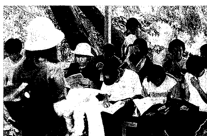
本庄市レクエーション指導者協議会「ネイチャーゲーム」

向上や余暇時間の増大を背景として、県民のスポーツ・レクリエーション活動への関心が高まっております。このような県民の要求に応えるため、地域や職場等におけるレク指導者の養成とその資質向上を図っております。この養成講座を終了し、テストに合格するとレクインストラクターとなります。その上、研鑽を積みますとレクコーディネーターとなります。本庄市には現在、五名のコーディネーターと、十三名のインストラクターがおります。活動内容は市民対象の野外活動講習会や、高校生ボランティアセミナーへの講師派遣、本子連りダー講習会のお手伝い等の行事を行っております。また要請に応じて、レクゲーム、ネイチャーゲーム、ニュースポーツ等の指導も行います。どうぞレクに関心のある方、レク指導者養成講座受講希望者はお電話下さい。お待ちしております。