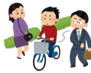
一時不停止 歩行者妨害