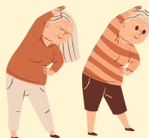
地域で行われている ラジオ体操への協力 など

受講後は、みなさまそれぞれが、無理のない範囲や時間の中で、多様な活動を通して活躍されています。