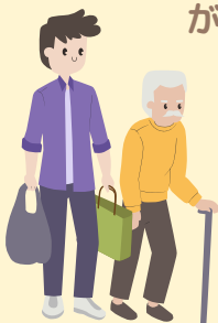
買い物の お手伝い